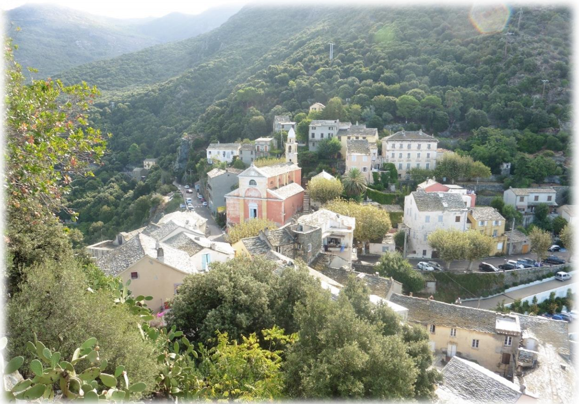
Nonza heeft ook nog een oude prachtig gerestaureerde Genuese toren, de Torre di Nonza uit de 16 de eeuw. Nonza dat is het echte Corsica, volgens mij een van de mooiste bergdorpjes van Corsica.