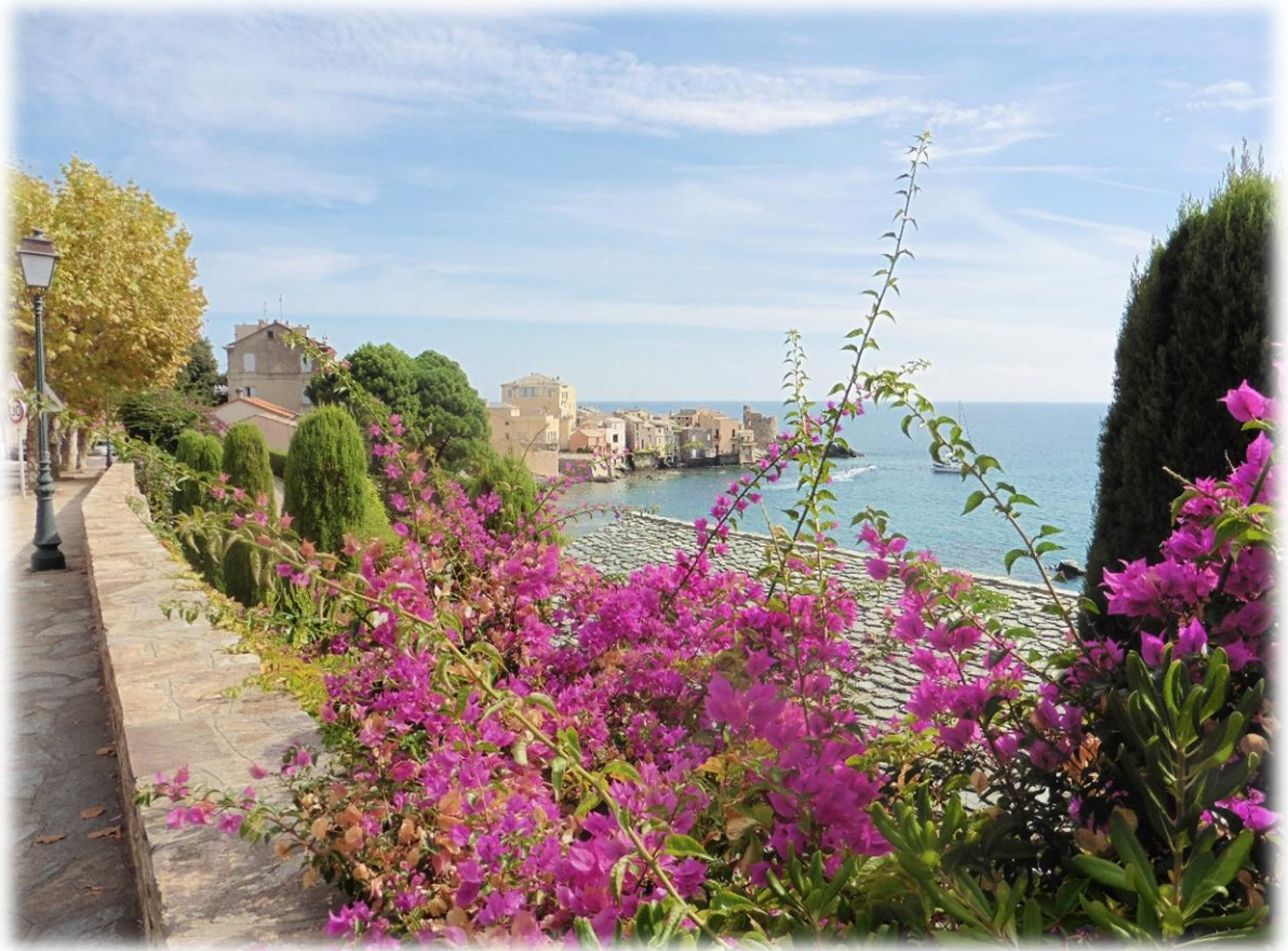
Beneden aan de zee kom ik in het Middeleeuwse dorpje Erbalunga. De helft van het dorpje is verkeersvrij, er zijn veel toeristen.