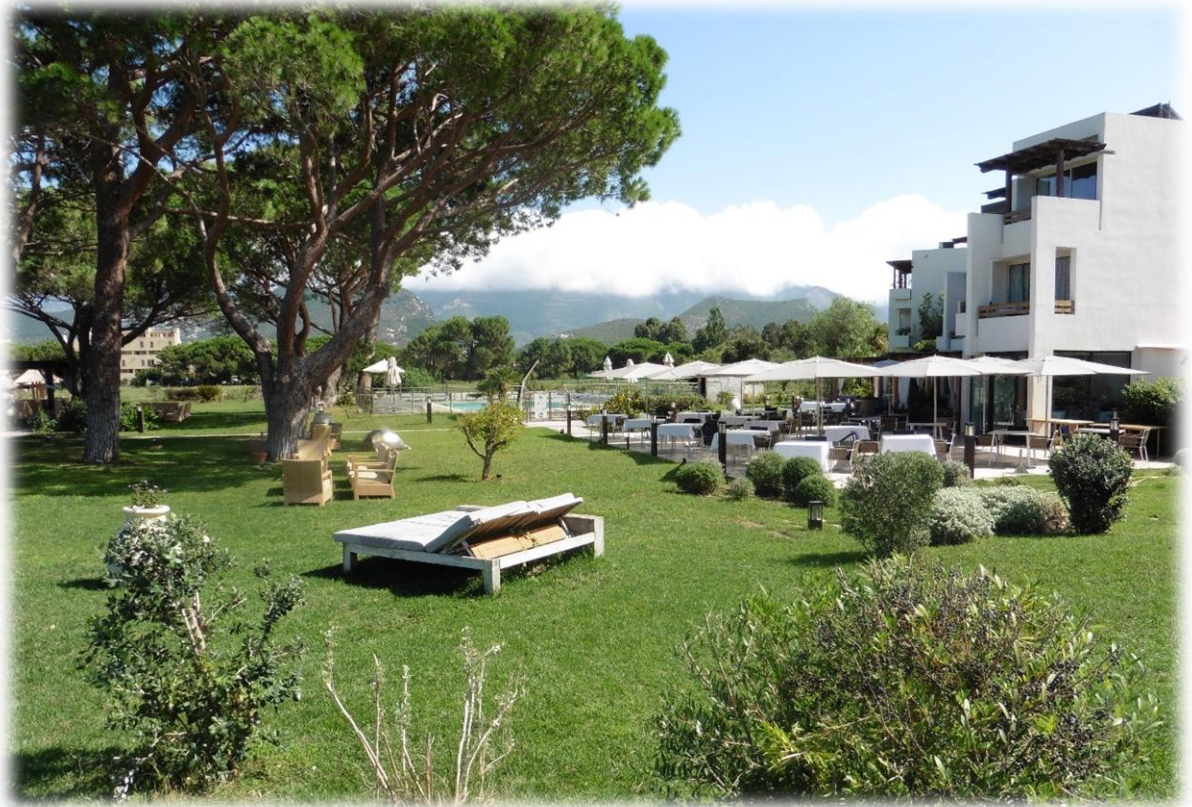
Ik moet door de tuinen van een poepchique 5 sterrenhotel aan de rand van Saint-Florent.