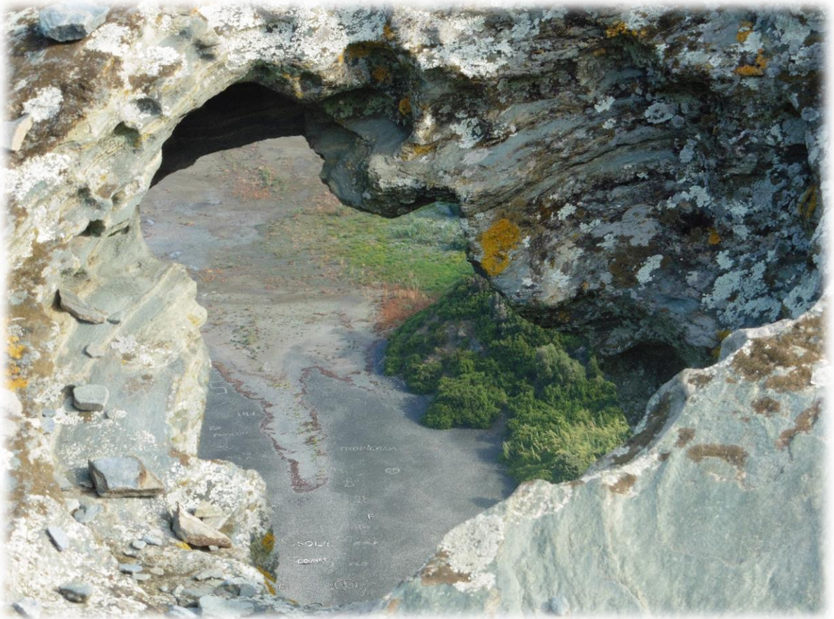
Nabij de toren vind je ook een rots waar door erosie een gat is ingeslepen met de nodige mooie fotoplaatjes als gevolg. Dit is één van de ongekende schatten van Corsica.