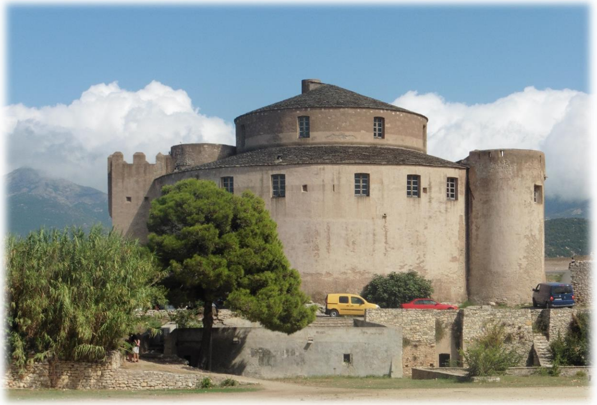
Van aan de citadel heb je een mooi prachtig zicht op het dorpje en zijn haventje.